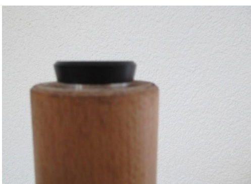
Table en bois

Encastrer le NIVELER dans le tube d'acier Le filetage M8 est soudé dans le tube en acier